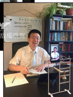
網路安息日聚會分享者

自4月15日開始，部分信徒也持續參加歐陸教會每週三、五下午的線上基本信仰學習。藉著疫情，教會也鼓勵同靈好好利用難得的閒置時間多禱告、多在網路上觀看本會各地教會的聚會視頻和資訊，並在莫斯科教會的微信群和QQ群裡彼此分享。感謝神！有的同靈克服時差的不便，全程觀看美國教會線上靈恩會的直播，有的信徒持續參加中國福建教會每晚的線上聚會。