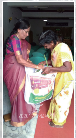
女執事在教會中分送必需品