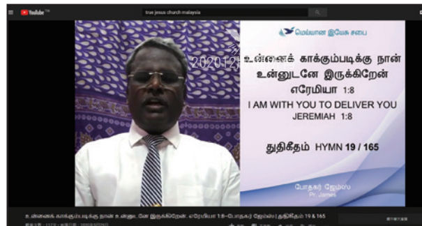
預錄的淡米爾語講道