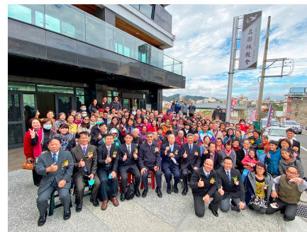
2021. 12. 26 關西祈禱所成立感恩聚會

關西福音之進展沿革，始自主後1991年迄今逾三十載，中間迭有起伏，但思及神一路帶領，早期由新竹及各地教會信徒參與投入，筆路藍縷，立志開拓客家地區福音聖工，雖一時未見具體成效，卻是工人訓練基地，也是慕道者的搖籃。及至龍潭成立、進而湖口、關西建堂，我們見到神已在客家地區動工，著實令人驚訝，立時樂歡呼。