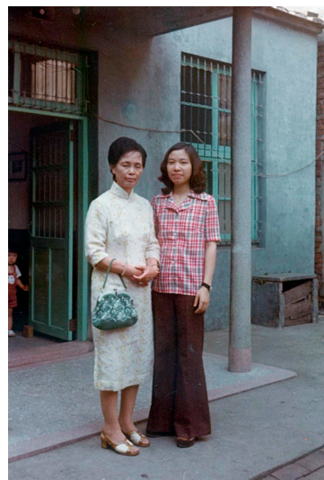
▲梁執事娘與秋英當年合照