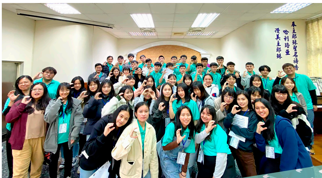
▲2021年12月 西大團契靈修會于仁愛教會

「西大團契」全名為「西區大專團契」，是目前隸屬西區唯一的一個大專團契。臺灣真耶穌教會現有的大專校園團契，大多數是由單一學校或幾所鄰近的大專院校之主內大專生所組成，有固定牧養的教會，是以校園為取向的大專團契。然而，與其他六個教區的大專團契不同的是，西大團契純粹是由西區出身的大專生所組成，直接由教區所牧養，是以教區為取向的大專團契。因此，凡原屬教會隸屬西區的大專生，都是「西大」的當然成員。