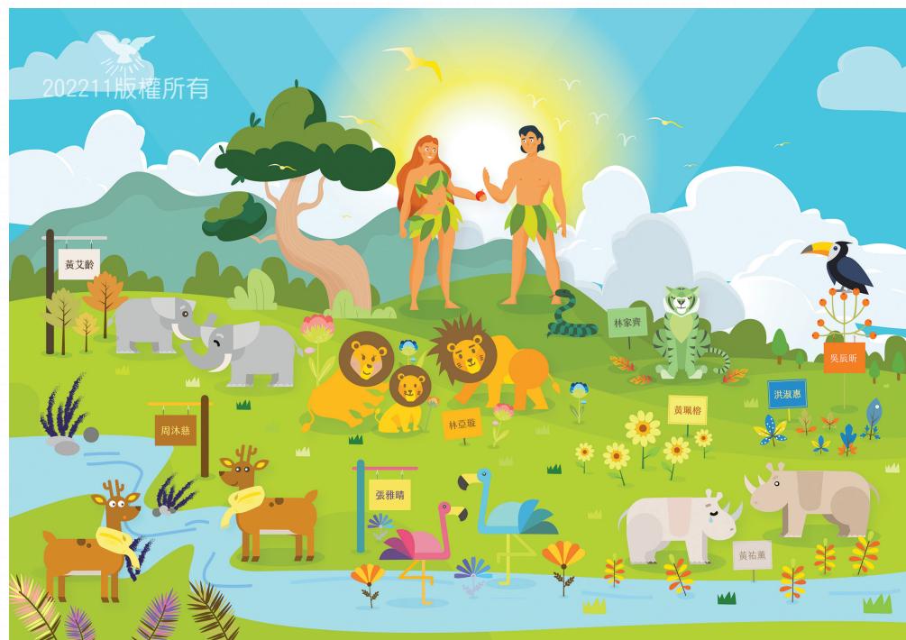
文宣營電繪組共同創作——伊甸園

在這次的文宣營中，學到了如何用向量繪圖的軟體來製圖，雖然並非本科系出身，但其實有修習過美術相關、介面設計、攝影等等的課程，所以還算聽得懂。但實作的時候卻跟想像中的差異很大，發覺需要許多經驗的累積，才能快速地勾勒出想要的線條，