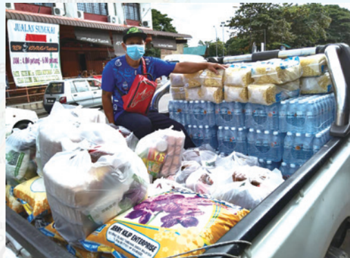
洪災後，緊急靠四輪驅動車子載送援助賑濟物資進入災區。

「遭患難的日子你當思想」（傳七14）。讓我們反省，這是否是對我們的警告？讓我們從舒適圈中做醒與謹守嗎？（帖前五6）。「所以要束縛你們的心，謹慎自守，專心盼望耶穌基督顯現的時候所帶來給你們的恩」（彼前一13）。神要我們靈修，使我們在走出這新冠病毒的危機之後，靈性能夠更加成熟，面對即將降臨的大患難（太二四21-29；啟七14）。