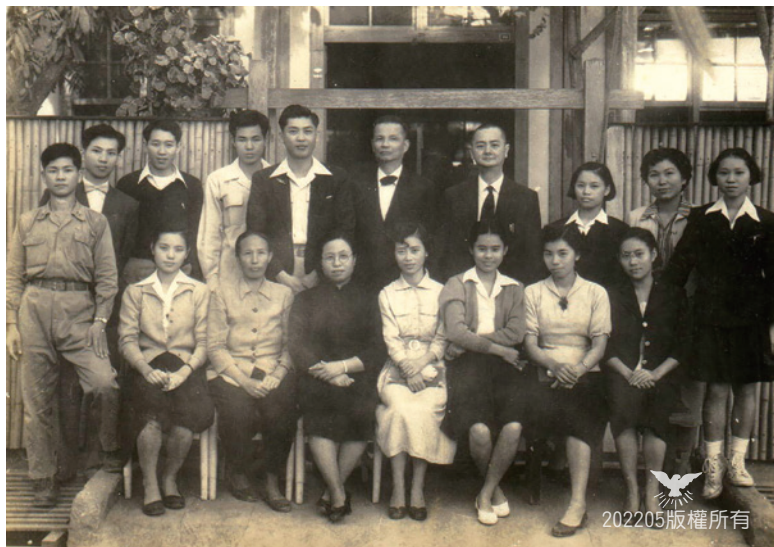
◀1958年起數年嘉義母會派赴內埔創建兒童教育體系的特遣示範隊，圖為1957嘉義母會兒童教員合照 13