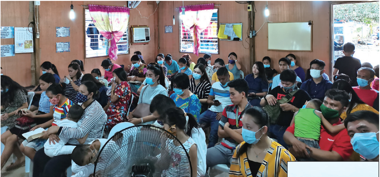
7月16-18日舉辦靈恩佈道會，87人參加，13人受洗。