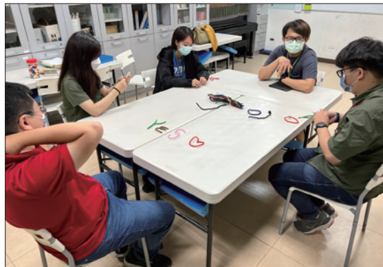
高階班教學老師培訓 高雄班