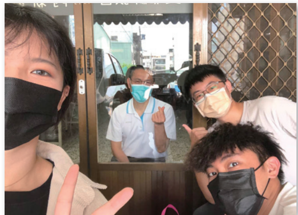
安息日小羊團契契員送來他們與太平社青共煮的母親節愛餐

感謝神的憐憫保守，被列為密切接觸者的妻小，進行三天居家隔離加上四天自主防疫後，兩度快篩也都是陰性，得以順利恢復生活步調，正常上班上課，盡都是神救我們