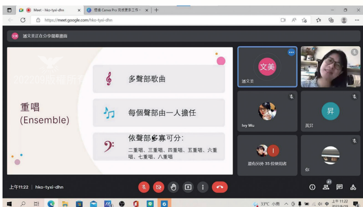
北區小型詩班成長營口唱心和課程畫面

1. 在1990年左右，北區大專聯契為在臺北教會舉辦福音茶會，臨時組成一個重唱團，這就是臺北小詩班（1991年成立）的前身。後來陸續成立景美小詩班、大同小詩