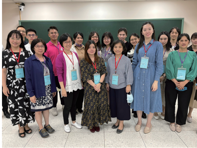
指揮研習營講員與學員照