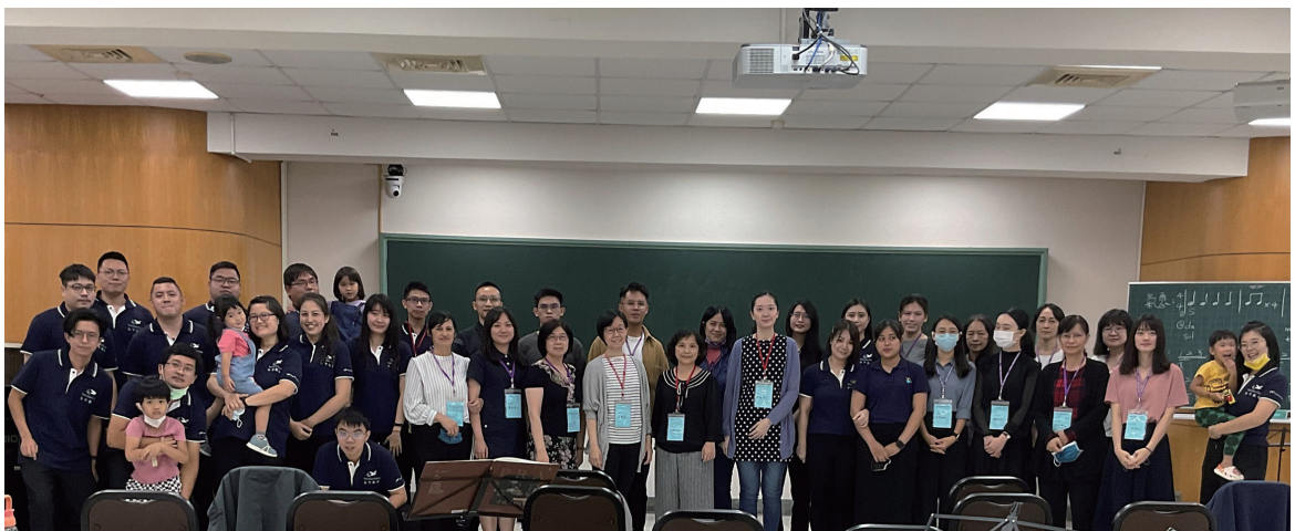
指揮研習營大合照