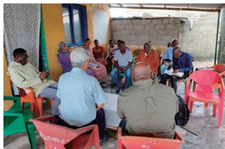
2023年7月29日 象牙海岸巡牧

在象牙海岸的宣教工作仍持續進行。去年，在經濟首都阿必尚（Abidjan），有一位宗教協會的執事，因收到教會的傳單而想要聆聽福音。他立刻明白且接受真理，並在同一天領受聖靈。今年，聖靈又降臨在他身旁的三個人身上。還有一位尋求真理的慕道友來訪，他帶領民眾一同到首都亞穆蘇克羅（Yamoussoukro），聆聽巡牧的同工們所帶來的福音。