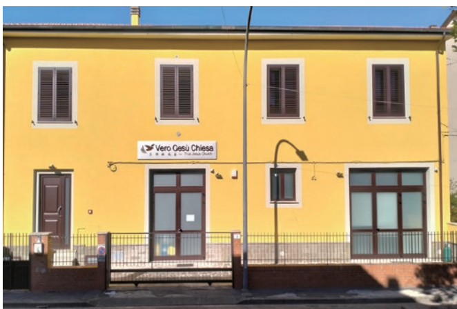
義大利恩波利祈禱所，年底前有望改為教會

在其他地區，我們也看到了一些成長。限制令解除後，有學生和家庭前往歐洲求學、工作和支援聖工，孩童們在當地出生並受洗。假如我們回顧現今在歐陸聯絡中心的會堂，可以發現，過去的十年間，幾乎每兩年就有一間教會獻堂。現在，我們應該增添更多神的兒女，使這些會堂被坐滿。