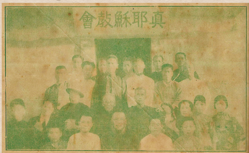
1930年12月第一次臺灣支部神學會於和美教會 17