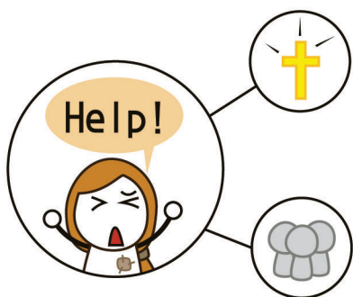
倚靠神，也求助於人