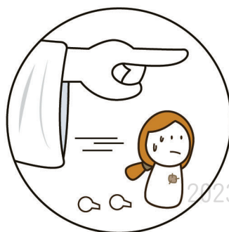
全心信靠，也要完全順服