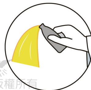
不管你擁有多少，神都可以施展神奇