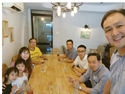
週日聚會後的團契