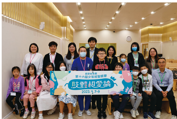
少年班聖經營於荃灣教會

今年4月，聯絡處在荃灣教會舉行了少年班聖經營，並以日營不過夜的方式進行。因為剛恢復與內地通關，久未回鄉的信徒都選擇了在復活節期間帶子女返鄉探親，以致於這次參與聖經營的學員人數減少，但感謝神保守一切順利。