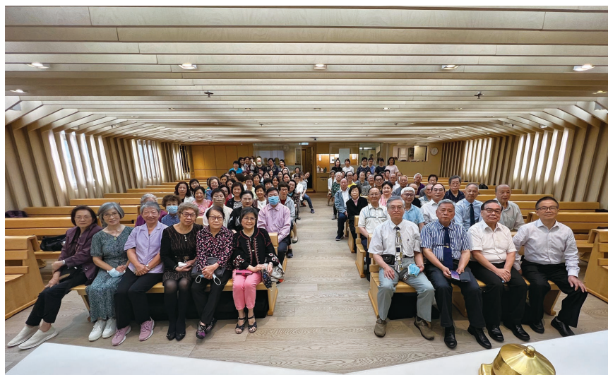
長青團契於香港教會

5月1日，全港長青聯合團契在香港教會舉行。長者們熱情參與，以詩歌彼此交流，並一起聚餐，和樂融融。這次有90多位長者參加，是歷屆最多的一次。 🌸