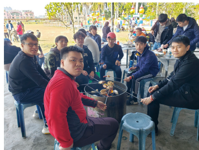
大埔宗教教育旅行

大埔教會也面臨人口老化，舉辦喪禮的次數增多，信徒數恐將萎縮。因此，未來將重點放在對外宣道，並為此加長晚間聚會後的禱告。