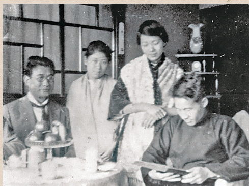
1923年蔣渭水（右）與首倡白話文的先鋒——黃呈聰（左） 在大安醫院裡商議要事，兩位夫人在旁聆聽 9

當時甫成立的「臺灣文化協會」，不避諱官方之監督，「文協」總部即設置於蔣渭水在臺北市的大安醫院自宅 10 ，蔣渭水雖因入獄之故，未能參與新、舊文學之論戰，然而卻以白話文大量創作所謂「獄中文學」，堪稱白話文運動的忠誠實踐者。