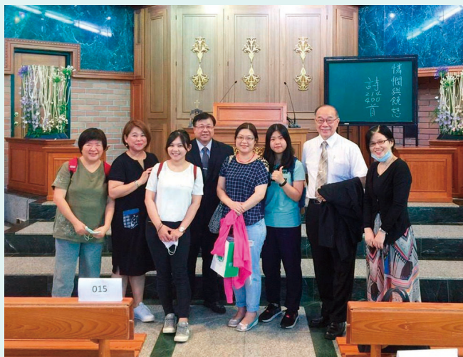
2020年5月16日 筆者（右三）與初次到教會的媽媽（右四）

夏令營結束之後，我收到葡萄園慕道班老師的訊息，邀請我到淡水教會，我就懵懵懂懂的來到教會。因為有社交恐