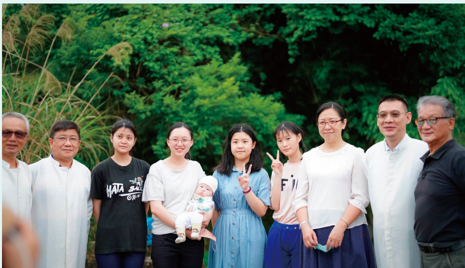
2022年4月 春季靈恩會筆者（右五）接受洗禮