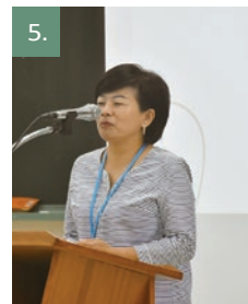
1. 繪圖組課程 2.3. 寫作組課程 4.開會式 5. 成果發表