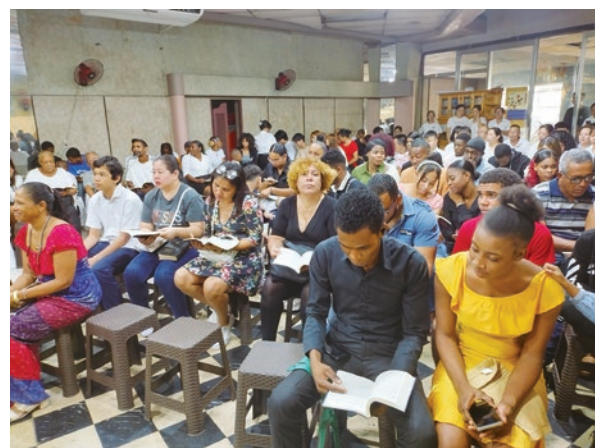
San Pedro 聚會點

在 San Pedro 的會堂最近也在硬體上做了整修工程，讓會堂更安靜，減低街道吵雜聲的干擾，另外也加裝空調設施，讓信徒有舒適的聚會與上課環境。蒙主聖靈感動與帶領，為了教育當地多明尼加信徒下一代的信仰，阿根廷教會的教員組織了多明尼加宗教教育小組。從2024年年初，透過網路為多明尼加的學員開辦西文宗教教育課程。