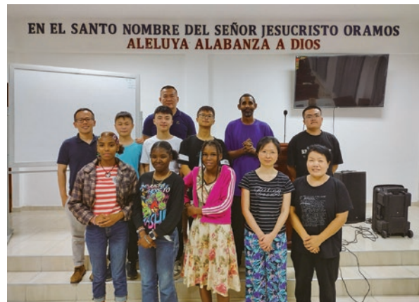
Santo Domingo 聚會點

華人信徒由於經商的緣故，散布在各個主要的城市，除了安息日聚會之外，華人信徒每月有三次週日晚間在首都的會堂舉辦團契聚會，出席人數約20-25人。感謝神的恩典，在首都的會堂整修工程，已經取得政府的建築許可，目前正在積極找尋合適的包商進行翻修。