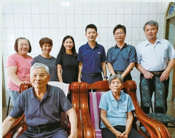
父母（前排）、筆者夫婦（後排中間）與教會同靈合照

母親除了胃不好，也有高血壓等慢性疾病，眼睛也在幾年前出現黃斑部病變，需要定期到醫院打針治療。但醫生表示，眼睛的