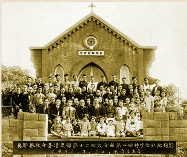
1936年第二次神學會於臺南教會