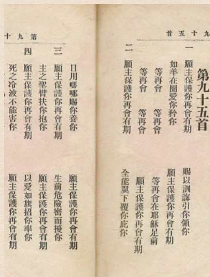
讚美詩95首《願主保護你再會有期》 19

蔡聖民執事記錄：「繼以支部負責的閉會辭，隨後唱詩第九十五首。在情緒感泣依依不捨的空氣裡，揮淚而別。從此各自奔向靈修，靈戰的實地上去！」 18