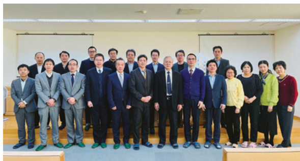
新任總會負責人與女執事

如今願景實現，美夢成真，如聖經上說，成就、造作、建立都在神，神將又大又難的事指示我們（耶三三2-3）。未來在關東的大山、新子安，關西的神戶、名古屋等地區，也將成立教會。神必引領開路，成全美事。求神增添國民、擴張四境（賽二六15），使日本教會重修牆垣，開展境界（彌七11）。