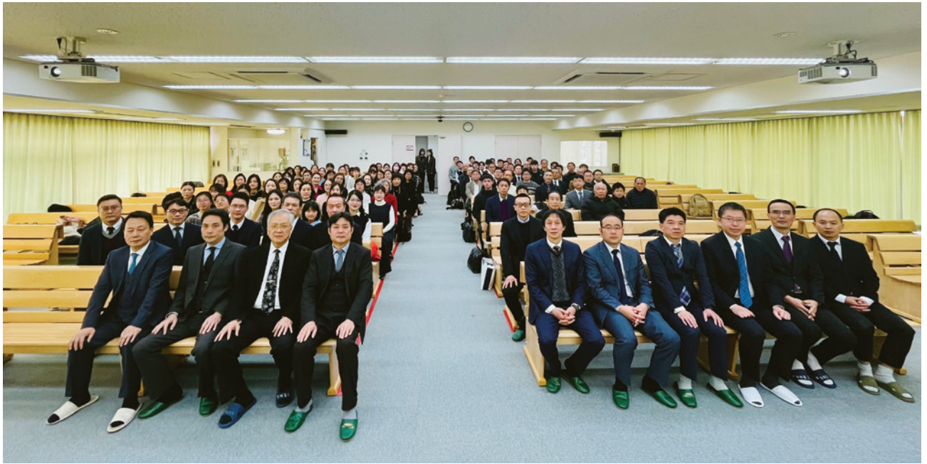
日本總會成立特別聚會大合照

願日本總會成立之後，與聯總各國總會及聯絡處，成為連絡整齊的一座城，願祂城中平安，宮內興旺（詩一二二6-7）。