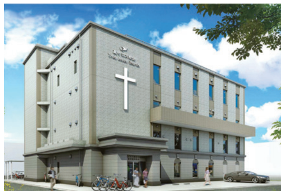
東京墨田教會新會堂外觀設計

在神奇妙的引領下，2015年4月，橫濱教會與千葉教會相繼成立；2018年10月28