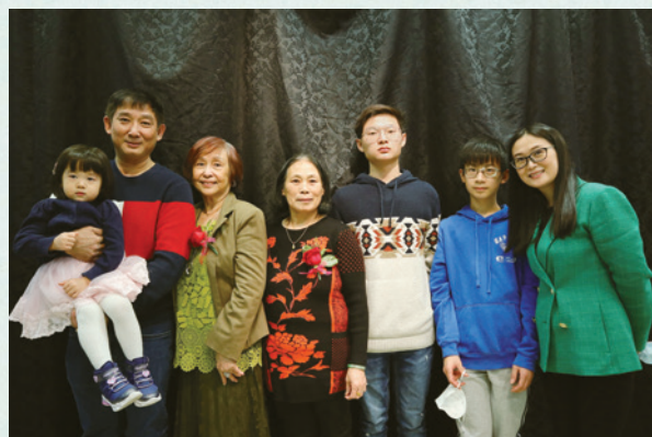
右一為筆者，右四為筆者母親， 手抱女兒者為筆者先生。

我自幼體弱多病，時常在半夜暈過去，帶去醫院檢查卻查不出病因，令父母十分擔心害怕。後來，一位其他教會的朋友帶媽媽到他們的教會。幾年之後，那位朋友得知真耶穌教會，就告訴媽媽原來真耶穌教會才是真教會。當時媽媽仍半信半疑，猶豫不決時，感謝神，讓媽媽看見異象：在一片紅色天空中，顯示著真耶穌教會。之後，她便來到真耶穌教會，接受了在活水中全身入浸的洗禮，以及與主有分的洗腳禮，也開始遵守安息聖日。