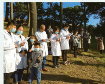
上）表哥一家於波士頓教會宗教教育教室 下）2020年表哥一家受洗