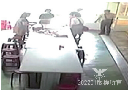
7點50分15秒，負責人離開現場

無預警突然遭遇此事，讓身歷其境的負責人們及弟兄姐妹，內心深感恐懼、害怕，但聖經的話語安慰我們，撫平了大家的心，讓我們再次感謝神的大憐憫與眷顧！