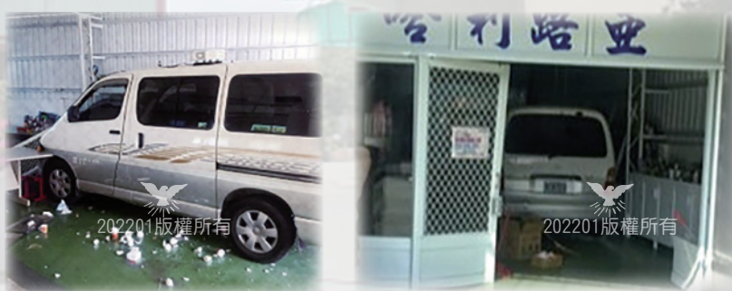
福音車暴衝，現場一片混亂。