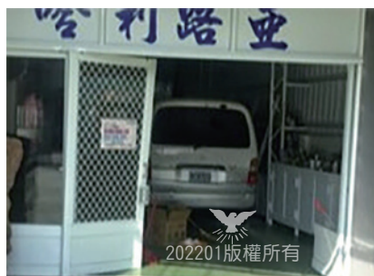
7點52分車子撞進來，相隔1分45秒