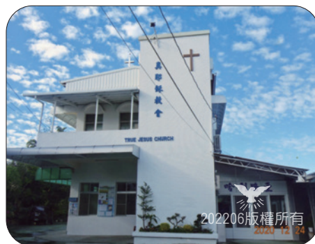
▲ 2020內埔教會新會堂全貌（附設學生中心）