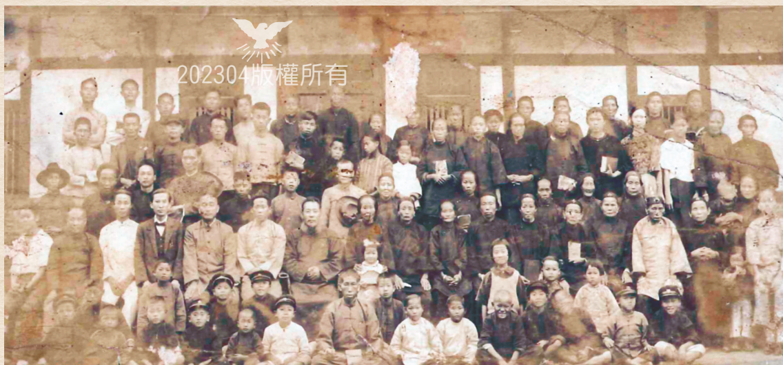
1930年神學會後，巡牧民雄，與教會同靈合影